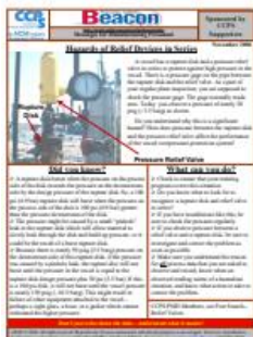
Εικόνα 1 Beacons Ασφάλειας Διεργασιών σε διάστημα 20 ετών

Πριν από είκοσι χρόνια, μια ομάδα εκπροσώπων από εταιρίες μέλη του CCPS συναντήθηκε και αποφάσισε ότι χρειαζόταν ένα νέο εργαλείο ασφάλειας διεργασιών. Αυτό το εργαλείο προοριζόταν για τους εργαζόμενους της πρώτης γραμμής – κυρίως προσωπικό λειτουργίας και συντήρησης. Το αποτέλεσμα ήταν το CCPS Beacon Ασφάλειας Διεργασιών. Από την πρώτη έκδοση το Νοέμβριο 2001 ως έγγραφο κειμένου, η επιτροπή το δημοσίευε κάθε μήνα και πλέον αποστέλλεται μέσω ηλεκτρονικού ταχυδρομείου σε περισσότερους από 30.000 συνδρομητές. Το αναγνωστικό κοινό έχει αυξηθεί από μερικές εκατοντάδες σε περίπου 1 εκατομμύριο.