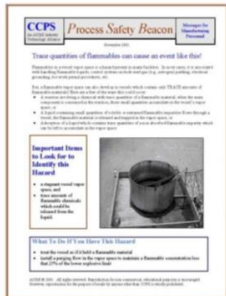
2001 оны 11 сар