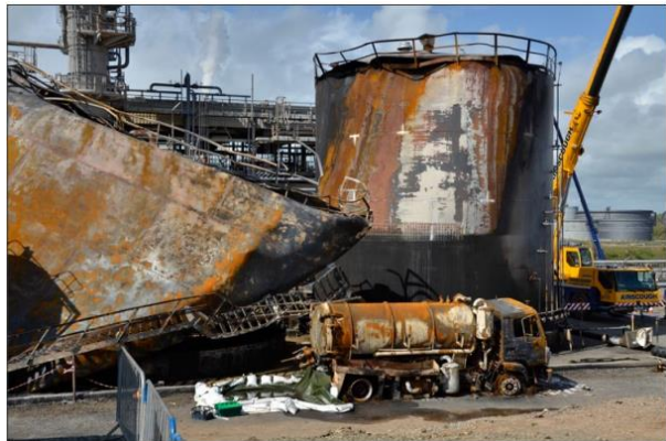
Рис 1. Последствия взрыва и пожара