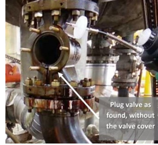
شکل 3۔ واقعے پڑاوالو

2021 ء لاپورٹ، ٹیکساس ء یک آسراتی یے ء سنے کنٹرول کارمند پلگ والوے چہ ایکٹیویٹر ء در کنگ ء انت۔ ایکٹیویٹر ہٹا دیگ بوھک ء ات کہ والوے پائینگ ء مرمت ء کار ء ہاتر ء توانائی ء تنہائی ء آلہ ء دروشم ء کارمرز کنگ بوت کنت۔ وھدے آہاں ایکٹیویٹر کش ات گڑا کارکنان نادانستہ والو ء سرادباؤ ء بر جہاد رگ ء اجزاء کش ات انت ء دباؤ ء والوے ہاڈی ء چہ پلگ درکت۔ بر فانی ایسٹنگ ایڈ ء میتھائل آؤڈائٹ ء زنگ ء زہریلا مرکب ء تقریباً 164,000 پونڈ (74,545 کلوگرام) چہ پچیں والوے ہاڈی ء دراتنگ۔ ہر سسٹم ٹھیکیداراں گول اے مرکب ء سپرے کنگ بوتنگ۔ دوچہ کارگراں کشندہ ٹپی بوتنگ انت۔ یک دیگ کنٹرول کارمند ء کپٹینی ء پوسودیوک سک ٹپنگ بوتنگ انت۔ بیست ء نہ مردم دیگ بہ گیشتریں ارزیابی ء درمان ء درمان آسراتی ء سرکنگ بوتنگ انت۔ (حوالہ سی ایس بی رپورٹ نمبر 2021-05-آئی۔ٹی ایکس)