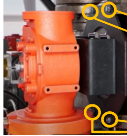
شکل 1۔ والو ایکٹیویٹر گول ماڈلنگ بریکٹ بولٹاں اجاگر کنگ بوتنگ